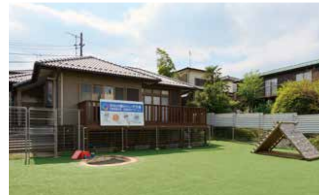
ゆめの園みらいず笠幡 児童発達支援・放課後等デイサービス ☎049-299-5262 埼玉県川越市笠幡4879-4