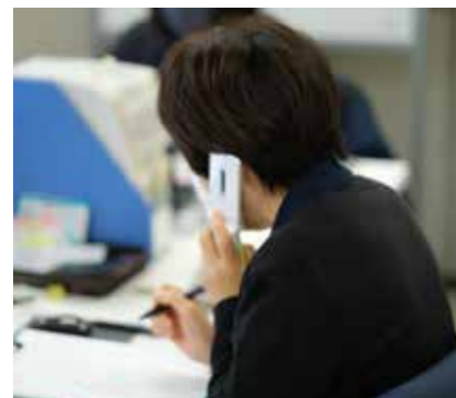
●相談チーム 入居者様やご家族様との連絡調整や、施設内でのケアプラン作成など行います。