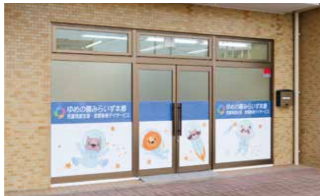
ゆめの園みらいず本郷 児童発達支援・放課後等デイサービス ☎048-871-7610 埼玉県さいたま市北区本郷町753番地