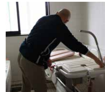
●介護チーム 「家族愛」をモットーに、入居者様と親子・兄弟のような間柄になることを心がけています。