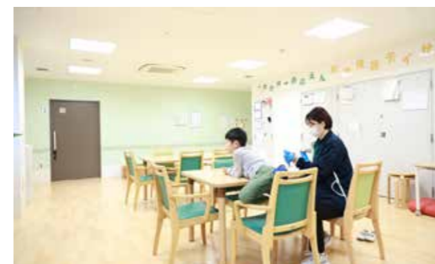
ゆめの園みらいず若葉 放課後等デイサービス ☎03-3935-5780 東京都板橋区若木3-15-1