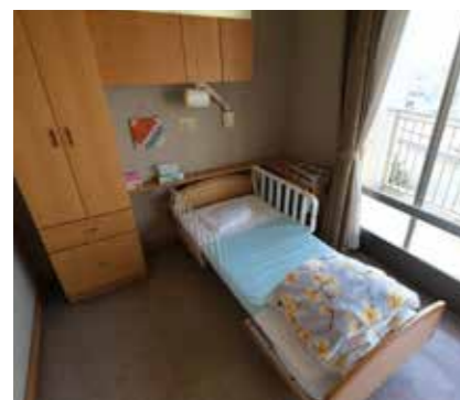
●ショートステイ事業所 ご家族様のご予定があるときや、リフレッシュ時にお気軽にご利用ください。

りあん中野林は、すべて4人一部屋の多床室となっております。集団生活ならではの、毎日のレクリエーション活動、毎週のクラブ活動、毎月の行事、といった入居者様の楽しみと生きがいをもっていただくためのイベントを行っています。 併設のショートステイ事業所は20床あります。衣類・介護用品の無料貸し出しなど、ご利用時に必要な物品のほとんどを用意していますのでお気軽にお使いいただけます。