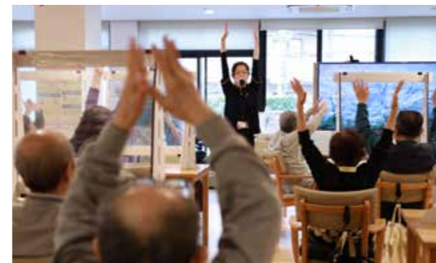
ゆめの園りふれ若葉 デイサービスセンター ☎03-3935-5780 東京都板橋区若木3-15-1