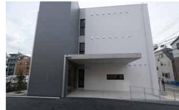
ゆめの園上宿 障がい者相談支援センター ☎03-6912-3218 東京都練馬区北町2-30-5 特定相談支援