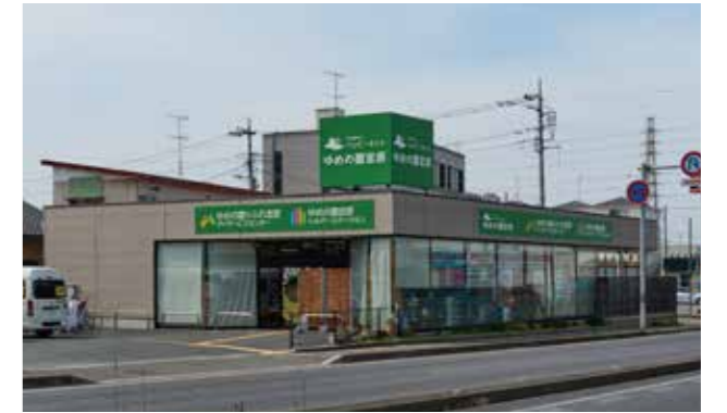
ゆめの園りふれ宮原 デイサービスセンター ☎048-660-0153 埼玉県さいたま市北区宮原町1-478