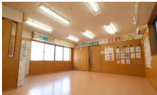
ゆめの園みらいず大宮 児童発達支援・放課後等デイサービス ☎048-626-1180 埼玉県さいたま市西区中野林653-5

ハッピーネットでは、さいたま市西区、北区と川越市、東京都練馬区、板橋区の合計9か所で障害児通所支援事業を展開しています。また、板橋区にあるゆめの園若葉では事業所内保育所を開設しており、職員のお子さんや地域のお子さんの健やかな成長を支えています。