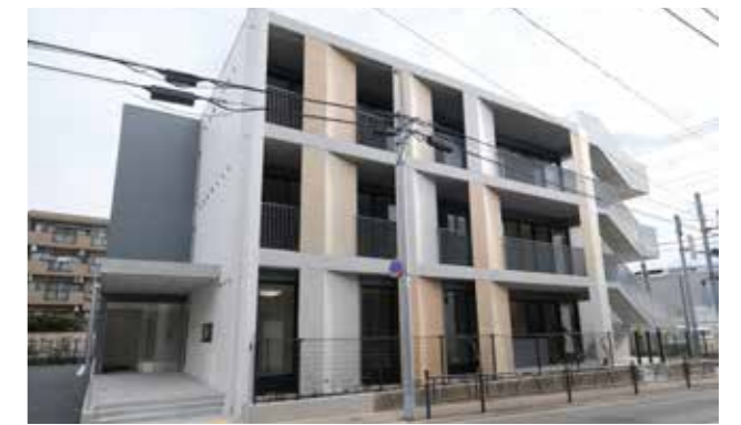
ゆめの園上宿ホーム ☎03-6912-3210 東京都練馬区北町2-30-5 共同生活援助 / 短期入所事業