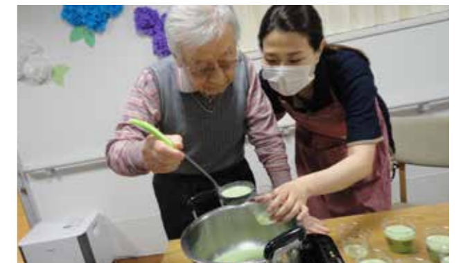
ゆめの園りふれ若葉 認知症対応型デイサービスセンター ☎03-3935-5780 東京都板橋区若木3-15-1