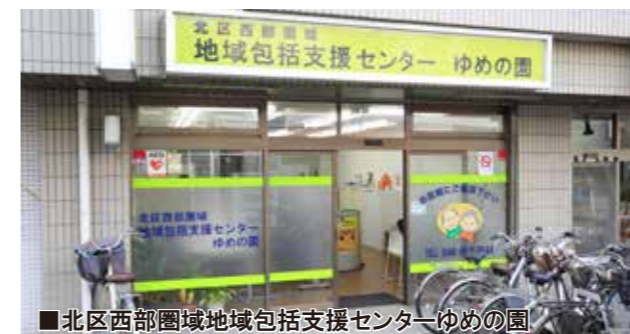
■北区西部圏域地域包括支援センター ゆめの園