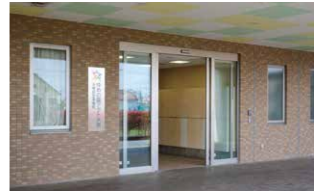
ゆめの園アクト大宮 ☎048-623-1810 多機能型事業所 埼玉県さいたま市西区中野林653-1 就労移行支援事業 / 就労継続支援B型 / 生活介護事業

ゆめの園アクトグループとして、利用者様の希望に合わせ「その人らしく輝ける場所」づくりを第一に、一般就労を目指した訓練や様々な授産活動、日中活動、余暇支援を提供しています。