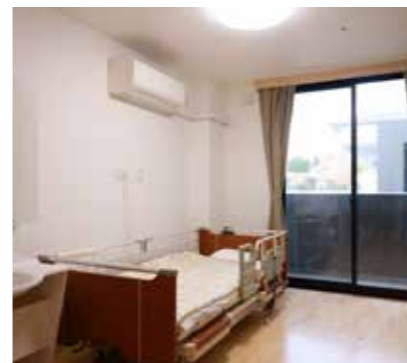
●ショートステイ事業所 ご家族様のご予定があるときや、リフレッシュ時にお気軽にご利用ください。

りあん若葉では、「最後の瞬間までその人らしさを追求し、いきいきと余生を過ごせる環境」をつくり出すことを目指し、個人を尊重した生活の確立を目的としながらも、家庭的な小集団の中でユニットケアならではのサービス提供をモットーに心がけています。 併設のショートステイ事業所は20床あります。短期間のご利用中でも楽しく過ごしていただけるような行事やイベントを行っています。お気軽にご利用ください。