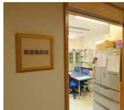
●看護チーム 毎日の体調管理や、体調不良時の看護など入居者様の健康を守ります。