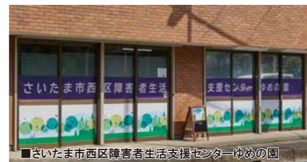
■さいたま市西区障害者生活支援センター ゆめの園

ハッピーネットでは、さいたま市から委託を受け、西区と北区で3つの支援センターを運営しております。お気軽にお立ち寄りください。