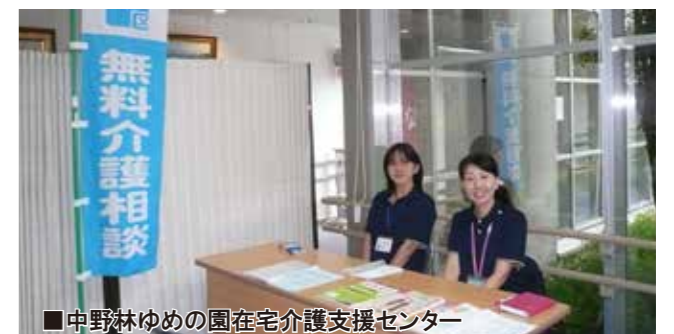
■中野林ゆめの園在宅介護支援センター