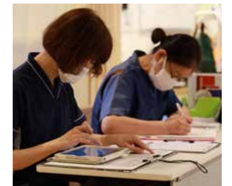
●看護チーム 毎日の体調管理や、体調不良時の看護など入居者様の健康を守ります。