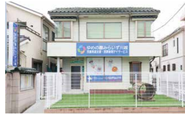
ゆめの園みらいず川越 児童発達支援・放課後等デイサービス ☎049-227-9866 埼玉県川越市末広町2-7-34