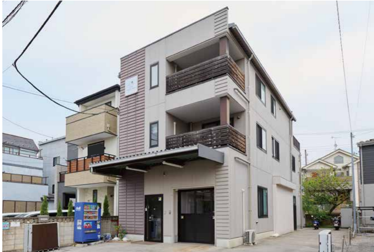
所在地：埼玉県さいたま市桜区南元宿 2-6-22 最寄駅：JR 埼京線 南与野駅 FAX： 048-767-3823