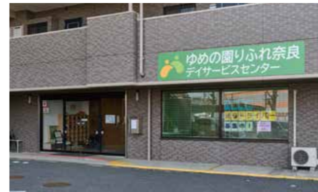
ゆめの園りふれ奈良 デイサービスセンター ☎048-661-6662 埼玉県さいたま市北区奈良町54-1