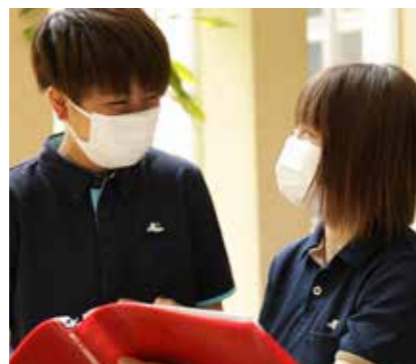
●介護チーム 「家族愛」をモットーに、入居者様と親子・兄弟のような間柄になることを心がけています。