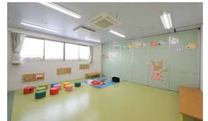
ゆめの園みらいず初雁 放課後等デイサービス ☎049-298-7170 埼玉県川越市大字松郷705-1